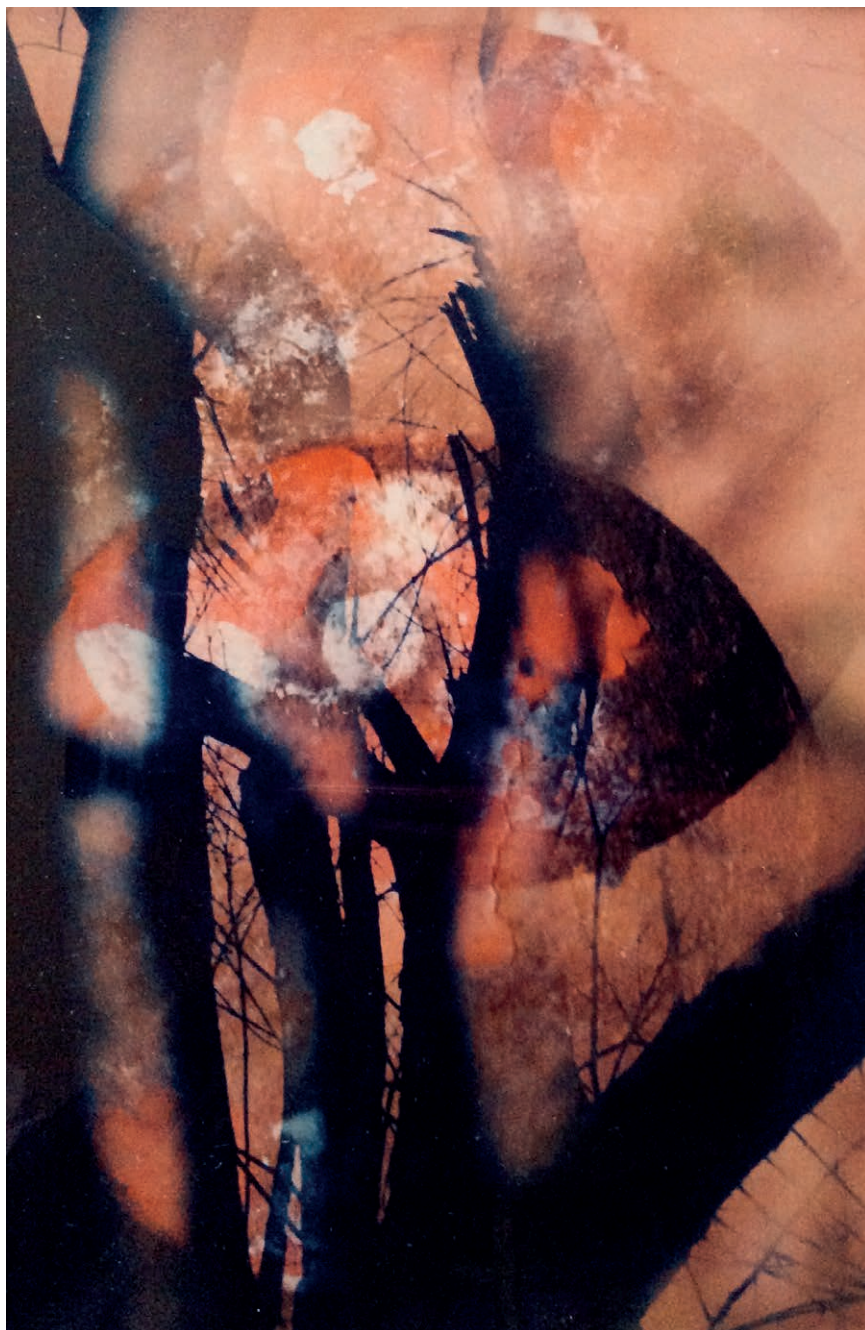
Lever du jour sur Mars