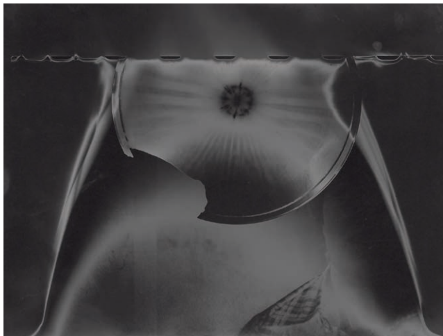
Soleil cou coupe

“het bewijs dat fotografie ook witte magie kan zijn die voor u, zij het maar voor één ogenblik, de grauwe voorhang van de ‘werkelijkheid’ openscheurt om u de ‘andere’ wereld te laten zien“